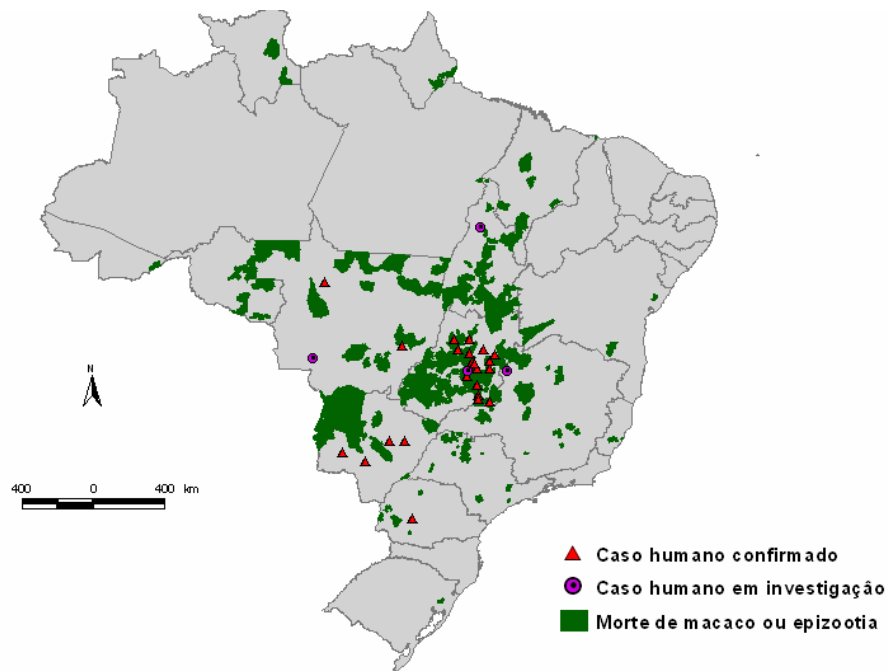
MAPA 1: Distribuição de municípios com registros de morte de macacos, epizootias por febre amarela silvestre e casos humanos (dez/07 a mar/08)

Obs.: Neste mapa estão registradas todas as mortes de macacos notificadas pelas autoridades de saúde e por cidadãos e cujas causas podem ser diversas.